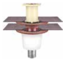
Siebeinheit für Balkongeschosse Nr. 16303X