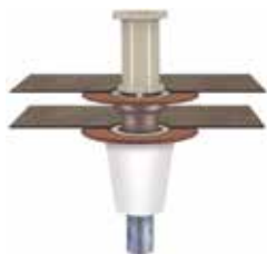
Siebeinheit, Serie F Nr. 15081X