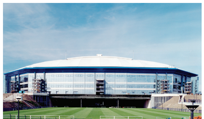
Stadien und Sonderbau: Dachentwässerung