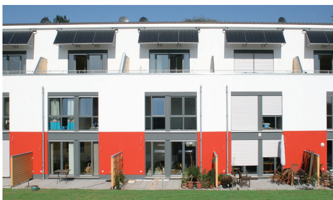
Wohnbau: Attika- und Balkonentwässerung