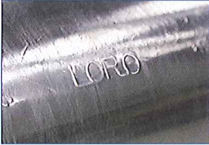
LORO-X Stahlabflussrohre und LORO-X Formteile Kennzeichnung in Längsrichtung auf dem Rohr.