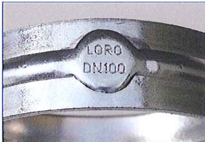
LORO-X Rohrschelle LORO-Schriftzug auf dem geprägten Außenring der Rohrschelle.