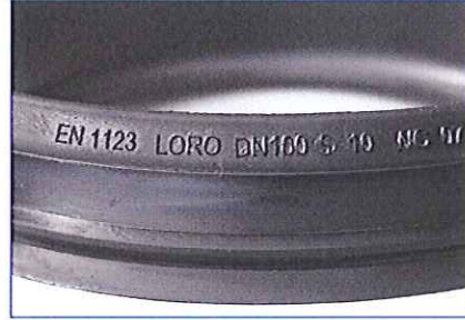
LORO-X Dichtelemente Kennzeichnung auf dem Kragen des Dichtelements.